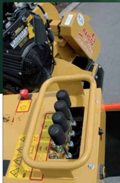
Freie Sicht auf das Fräsrad und den Baumstubben

Die Vereinfachung und Übersichtlichkeit der Arbeit war der Ausgangspunkt für den neuartigen, in drei feste Positionen schwenkbaren, Bedienstand. Dies bedeutet eine deutlich bessere Übersicht bei der Arbeit und beim Fahren. Dazu wurde die Verkleidung der Maschinen geändert – es ist ein praktischer Stauraum für Werkzeuge, Schmierstoffe etc. entstanden.