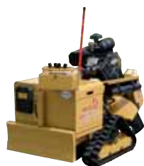
Mit Ketten kommen Sie überall hin – die RG 1635 Super Trac Jr