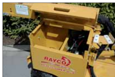
Praktisch – jetzt mit Werkzeugkiste

FS Forsttechnik Schültke Partner der Profis